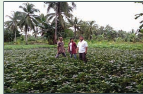
Tanaman Ubi Jalar [Sweet Potato Plantation]