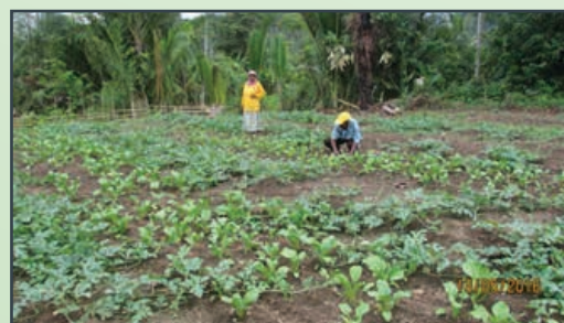
Tanaman Semangka dan Sawi [Watermelon and Mustard Plantation]