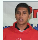
Penulis / Writer : Dance Rulan Liliefna. Fasdes Waepotih, Kec. Waplau, Kab. Buru