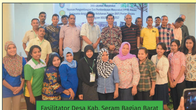
Fasilitator Desa Kab. Seram Bagian Barat