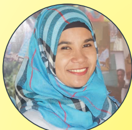
Hajara Hatalea Penerjemah