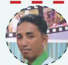
Penulis / Writer : Eliyas Pelu, Supervisor Kab. Buru Selatan.