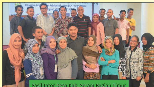
Fasilitator Desa Kab. Seram Bagian Timur