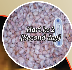
Hari ke 2 [Second day]