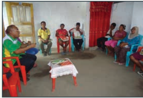
Visitation by Coordinator of YPPM in Tanjung Karang and Selwadu village to see how far the progress of SHG assisted by Village Facilitator.