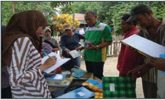
Kunjungan Koordinator YPPM ke desa Tanjung Karang dan desa Selwadu untuk melihat sejauh mana perkembangan KM yang di dampingi oleh Fasilitator Desa.