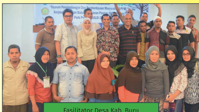
Fasilitator Desa Kab. Buru