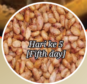
Hari ke 5 [Fifth day]

Cacao beans must be stirred after 48 hours (2 days) and after 96 hours (4 days).