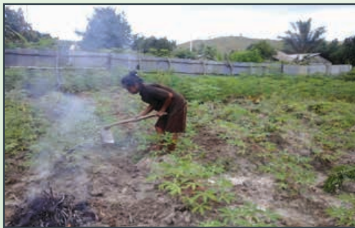
Tanaman Singkong [Cassava Plantation]