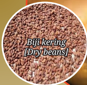
Biji kering [Dry beans]