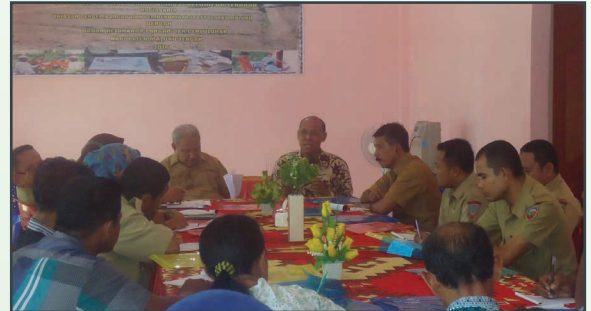
Kegiatan FGD di Kabupaten Maluku Tengah FGD in Central Moluccas District