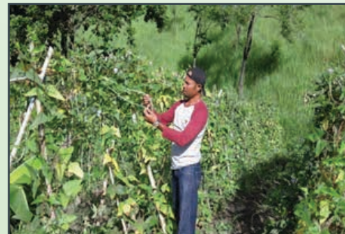
Tanaman Kacang Panjang [Long Bean Plantation]