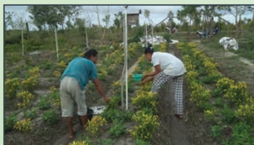
Tanaman Cabe [Chili Plantation]