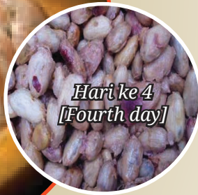
Hari ke 4 [Fourth day]