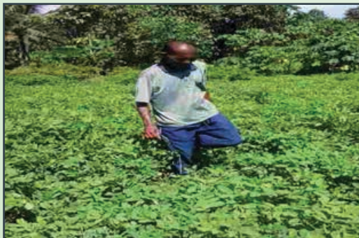
Tanaman Kacang Tanah [Peanuts Plantation]