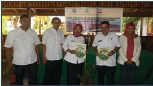
Photo session together with SOLID Management in Buru Regency after Dissemination activity and distribution of Kabar Kampong SOLID Tabloid.