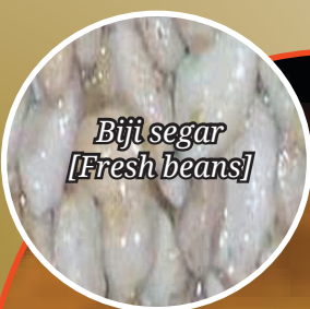
Biji segar [Fresh beans]