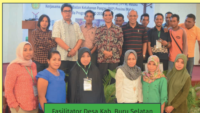
Fasilitator Desa Kab. Buru Selatan