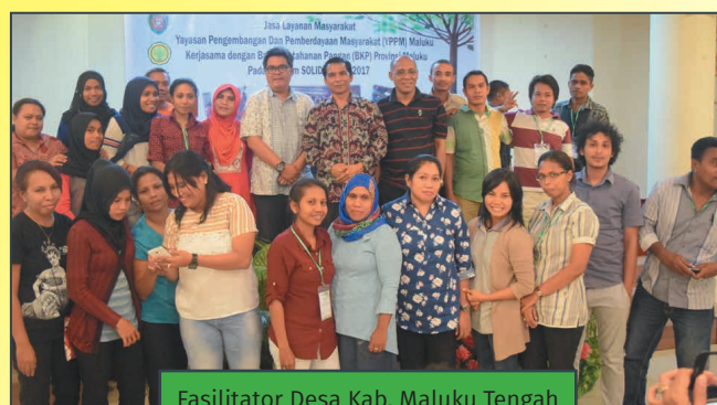
Fasilitator Desa Kab. Maluku Tengah