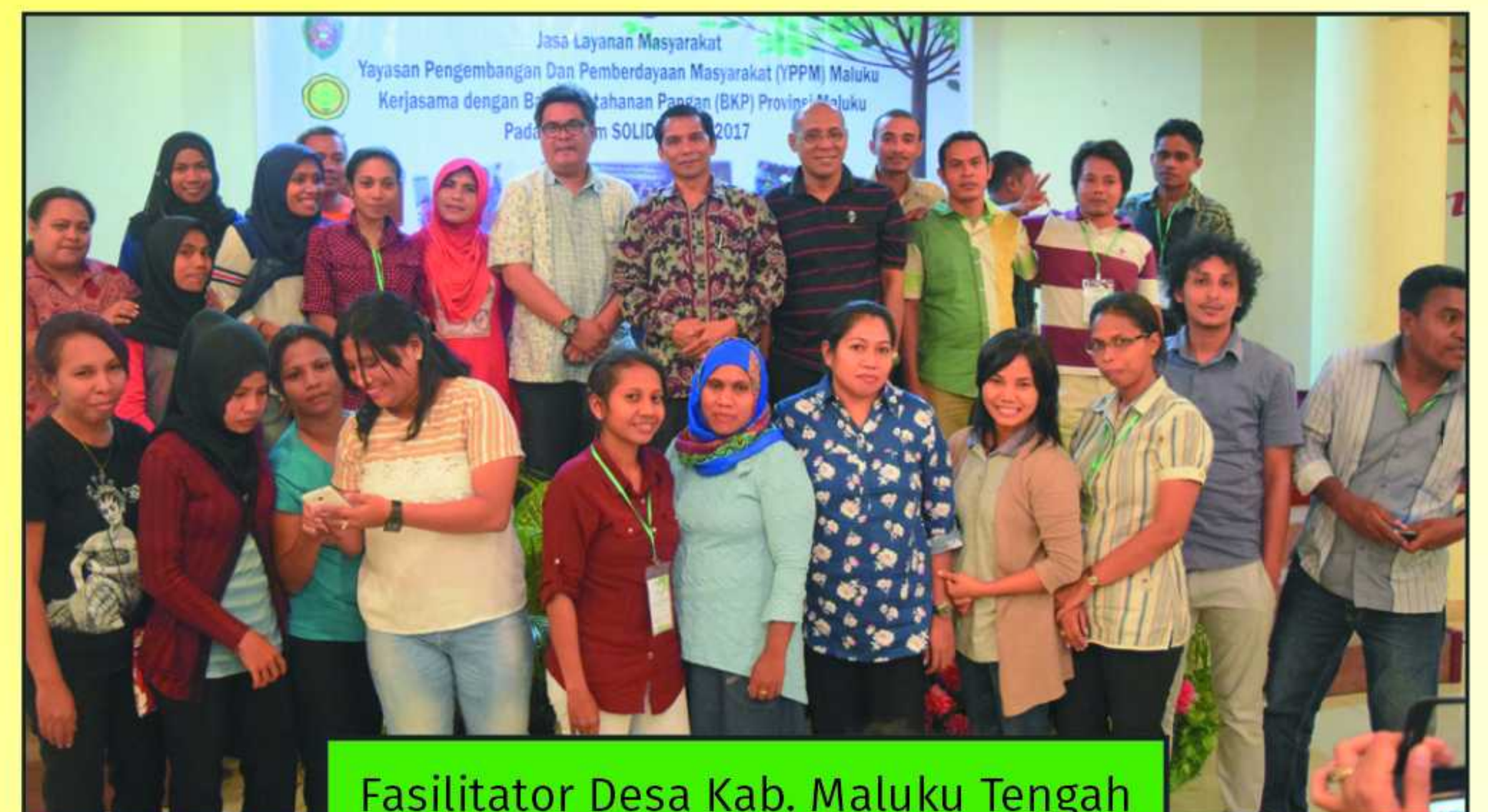
Fasilitator Desa Kab. Maluku Tengah