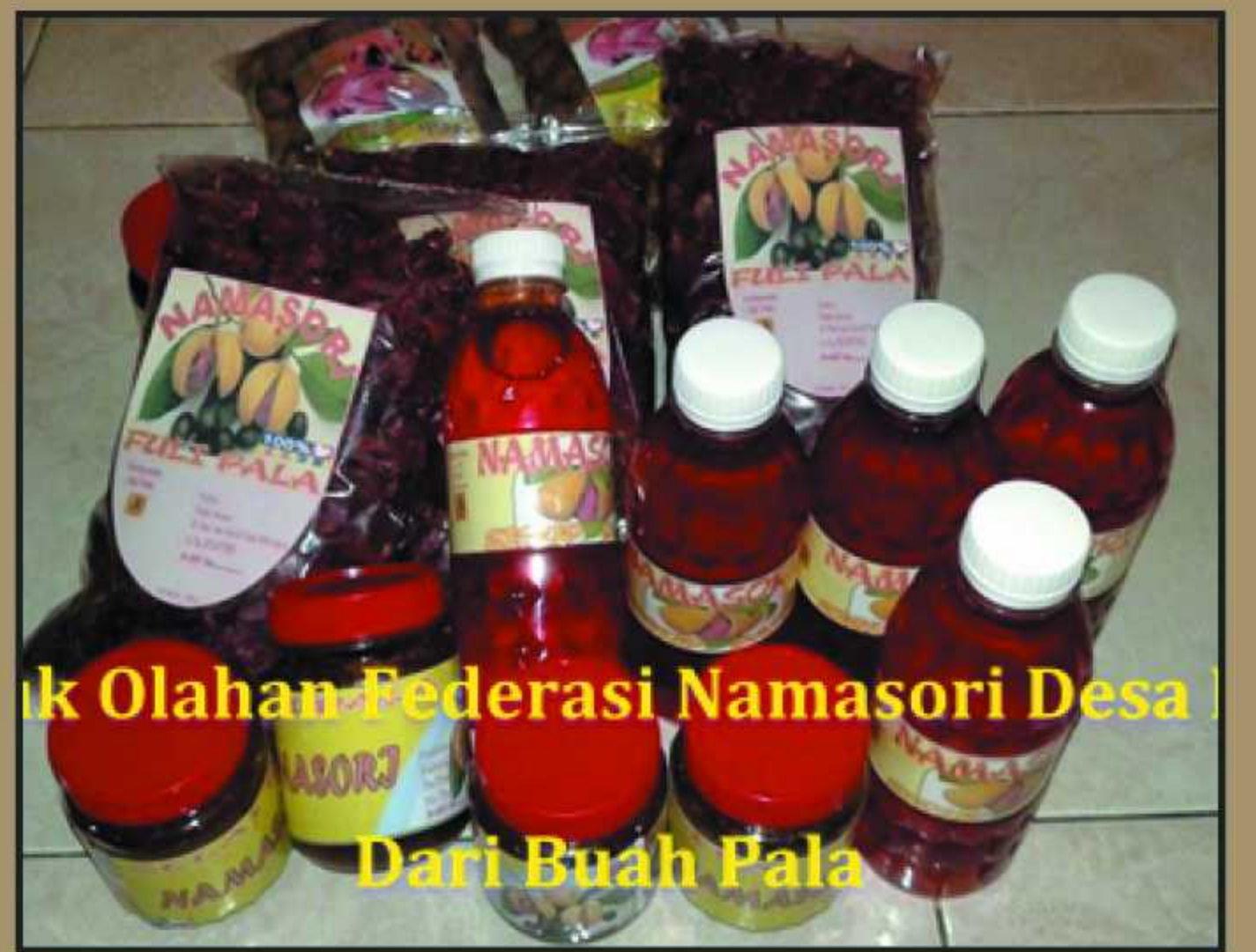
Produk buah pala olahan dari Federasi Namasori Desa Kasie Kabupaten Seram Bagian Barat.