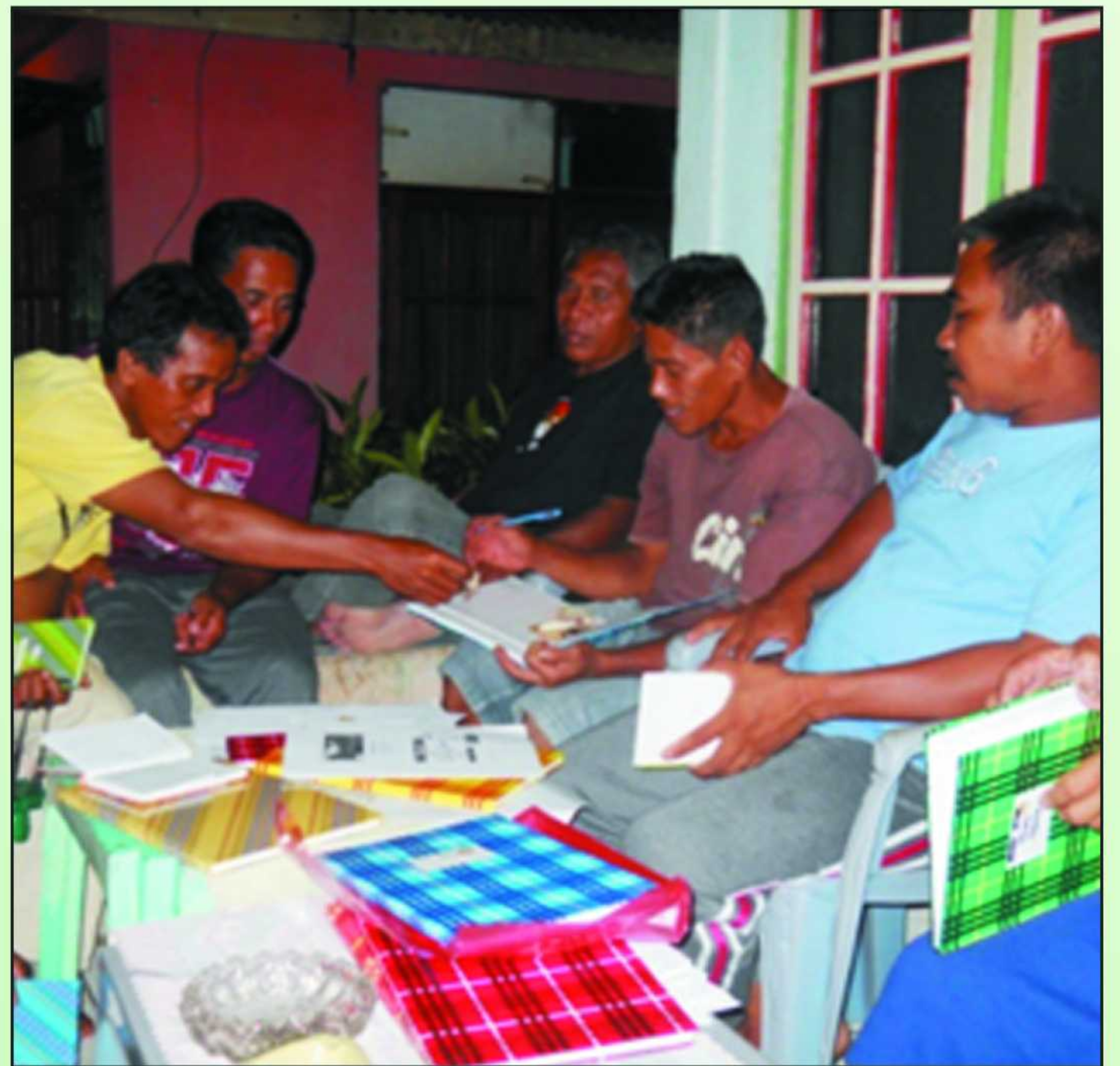
Penyerahan Iuran Pada Saat Pertemuan Rutin KM