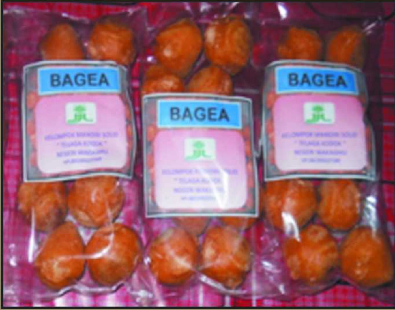
Produk Bagea dari Desa Wakasihu Kecamatan Leihitu Barat Kabupaten Maluku Tengah.