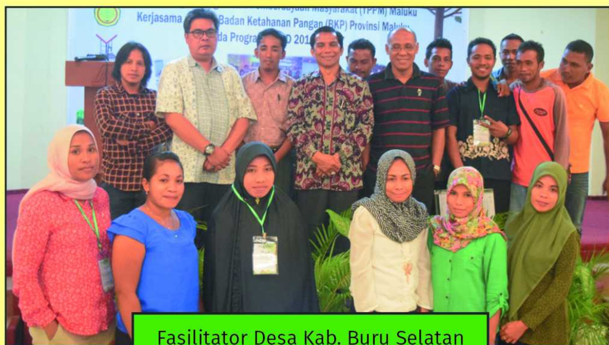
Fasilitator Desa Kab. Buru Selatan