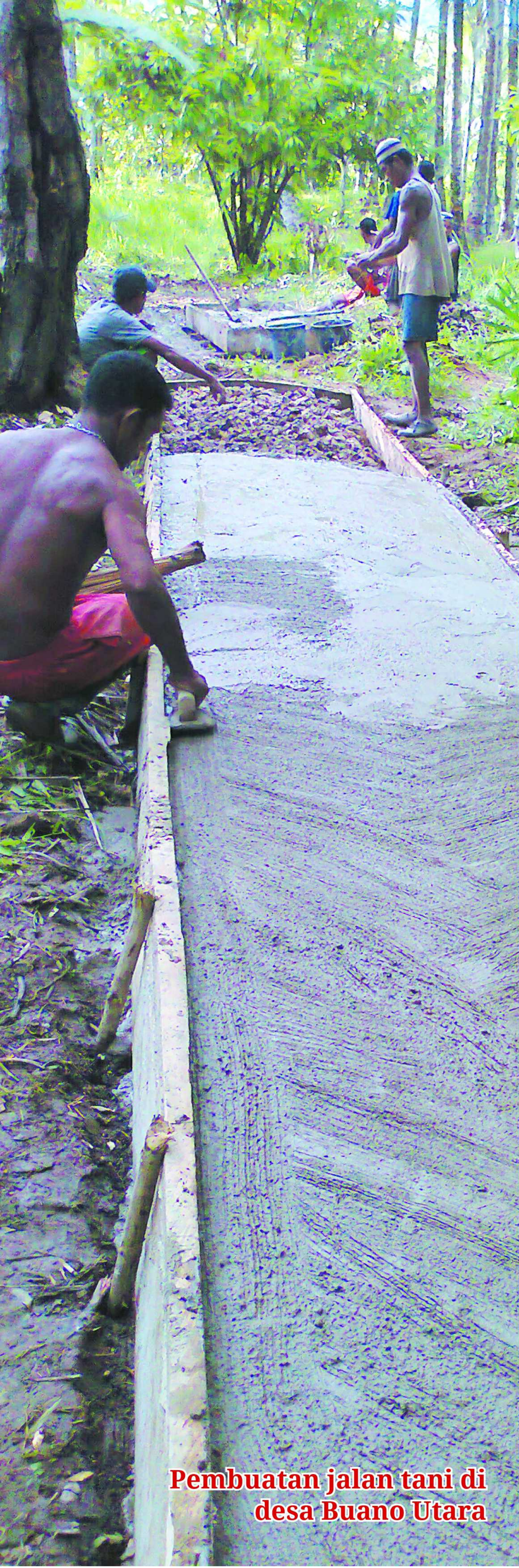
Pembuatan jalan tani di desa Buano Utara