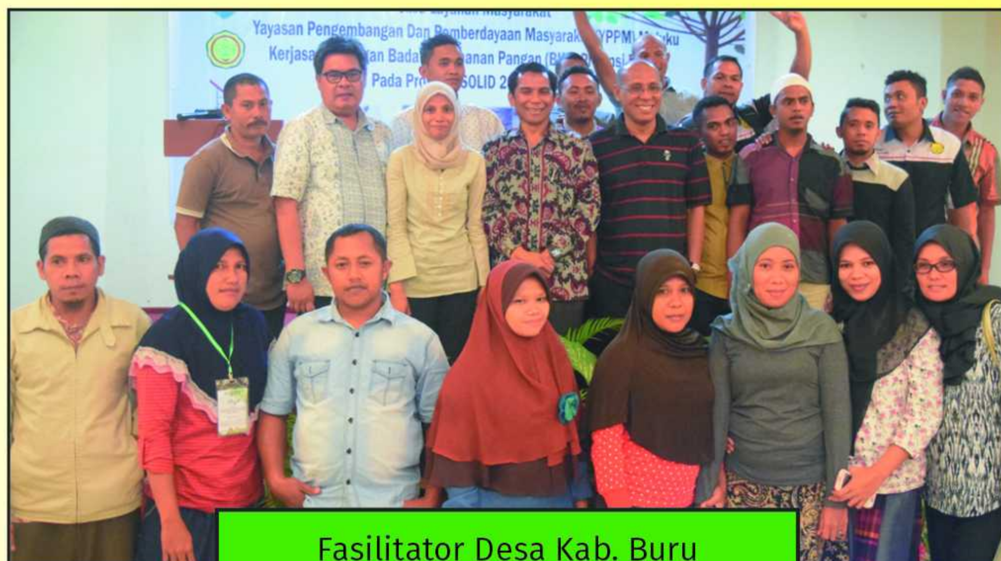
Fasilitator Desa Kab. Buru