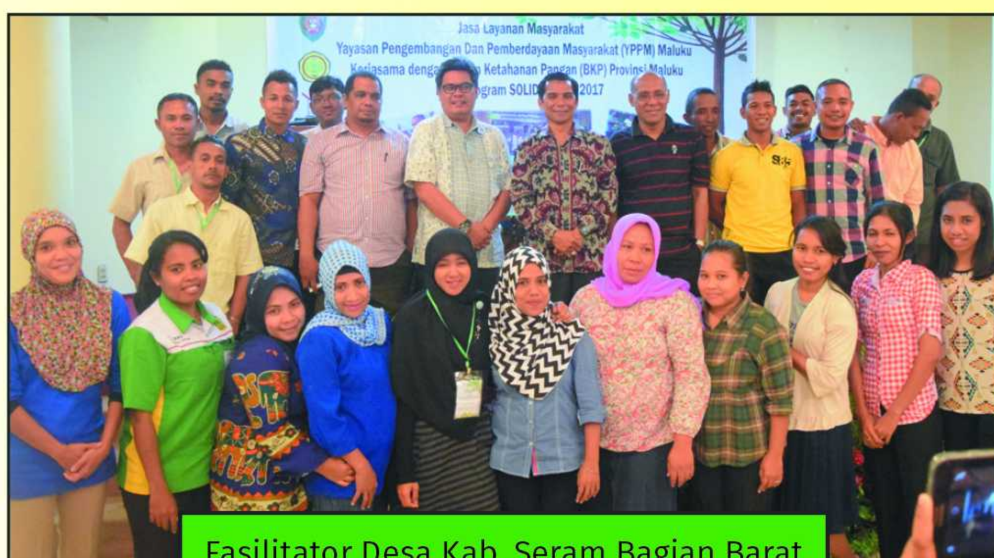
Fasilitator Desa Kab. Seram Bagian Barat