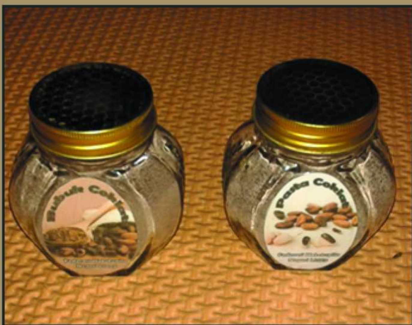
Permen Coklat (KAKAO) produksi Federasi Hatutupilu Desa Liang Kabupaten Maluku Tengah.

Produk-produk yang dihasilkan oleh Anggota Kelompok Mandiri di desa ini adalah hasil binaan dalam program SOLID di Provinsi Maluku. Oleh karena itu, dengan membeli produk-produk ini secara otomatis kita juga ikut membantu KM untuk semakin tumbuh dan berkembang, dapat mendorong masyarakat desa agar mampu/berproduksi dan mengolah hasil produksi desa, menciptakan lapangan kerja, meningkatkan pendapatan asli desa, dan dapat mendorong kehidupan perekonomian Desa.