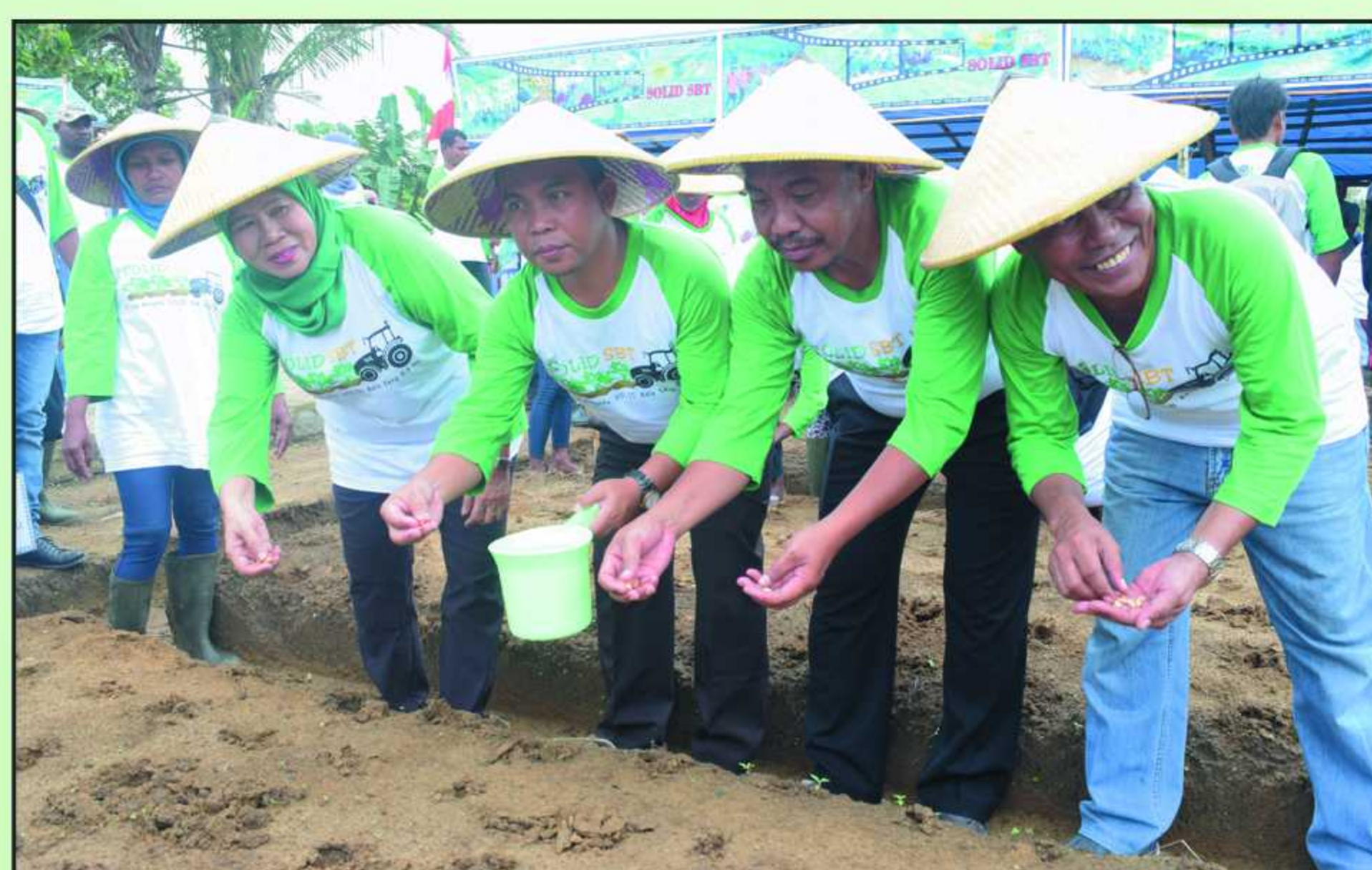
Penanaman kacang tanah perdana di Desa Solang, Kabupaten Seram Bagian Timur 28 April 2016.