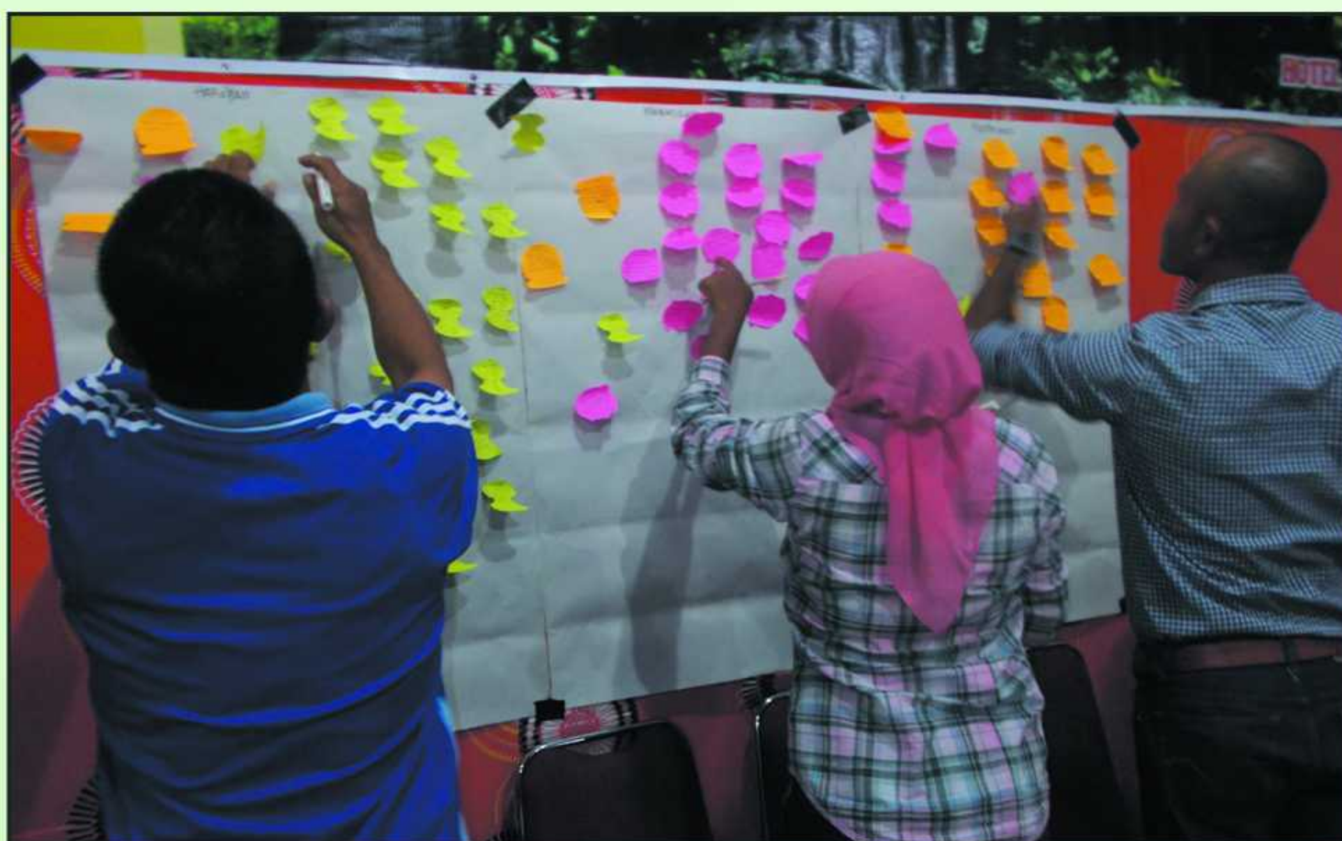
Pelatihan CD Gender dan Monev bagi PPL dan Fasdes oleh manajemen SOLID Kab. Buru, 20 - 23 April 2016.