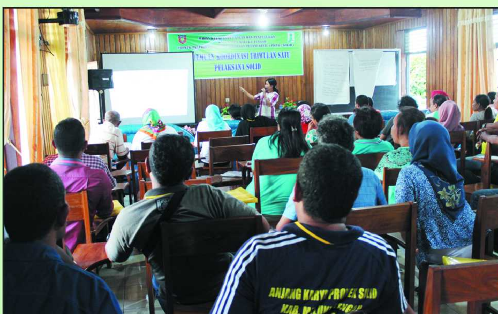
Workshop CD Gender dan Monev bagi PPL dan Fasdes oleh manajemen SOLID Kab. Maluku Tengah, 26 - 28 April 2016.