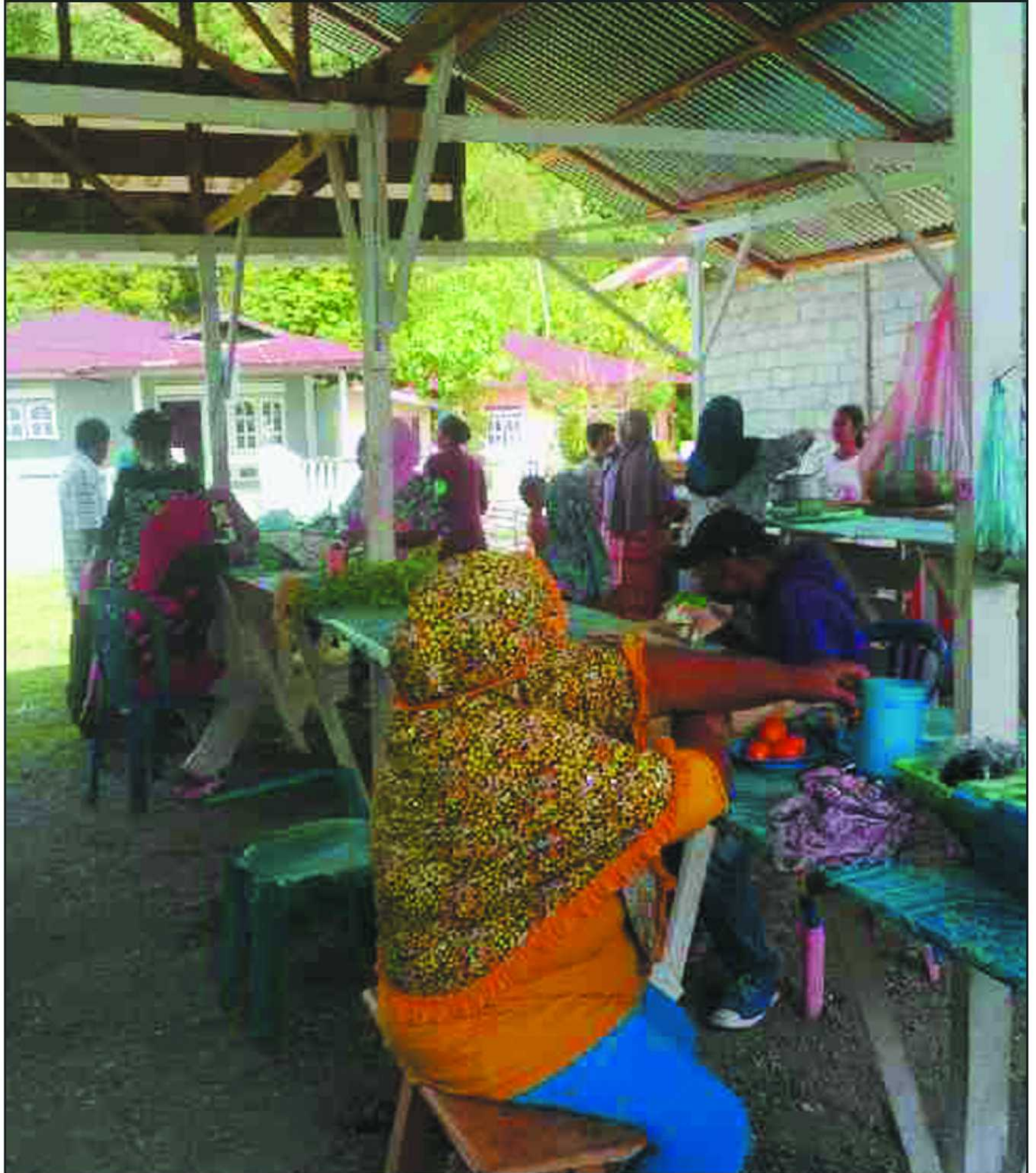
Aktifitas Pasar Solid Desa Hualoy, Kec. Amalatu, Kab. Seram Bagian Barat.

Berdasarkan latar belakang diatas maka Desa Hualoy Kec. Amalatu Kab. Seram Bagian Barat (SBB) membangun