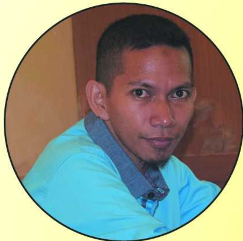
La Faisal Kaimudin Admin