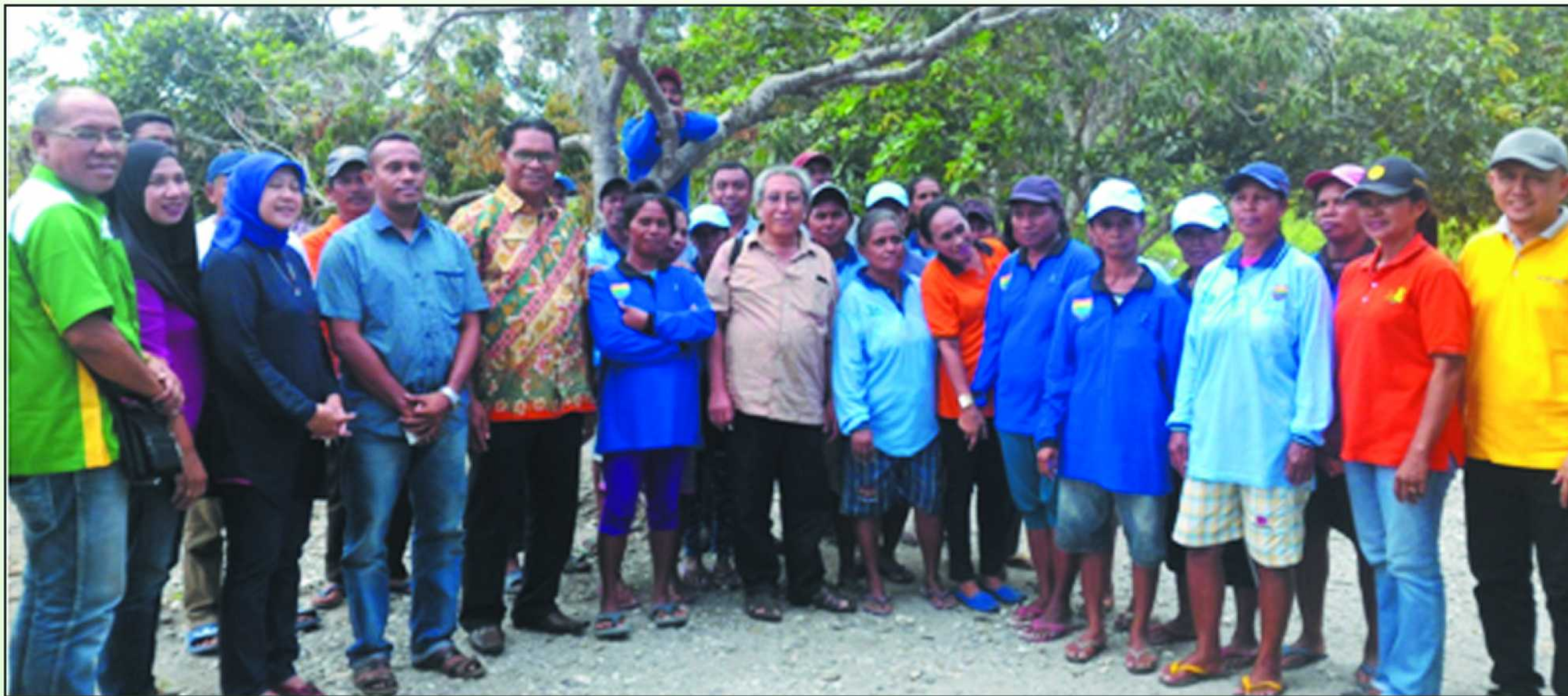
Kunjungan Kepala Pusat Badan Ketersediaan & Kerawanan Pangan ke desa Hatusua, Kecamatan Kairatu Kabupaten Seram Bagian Barat, 15 April 2016.