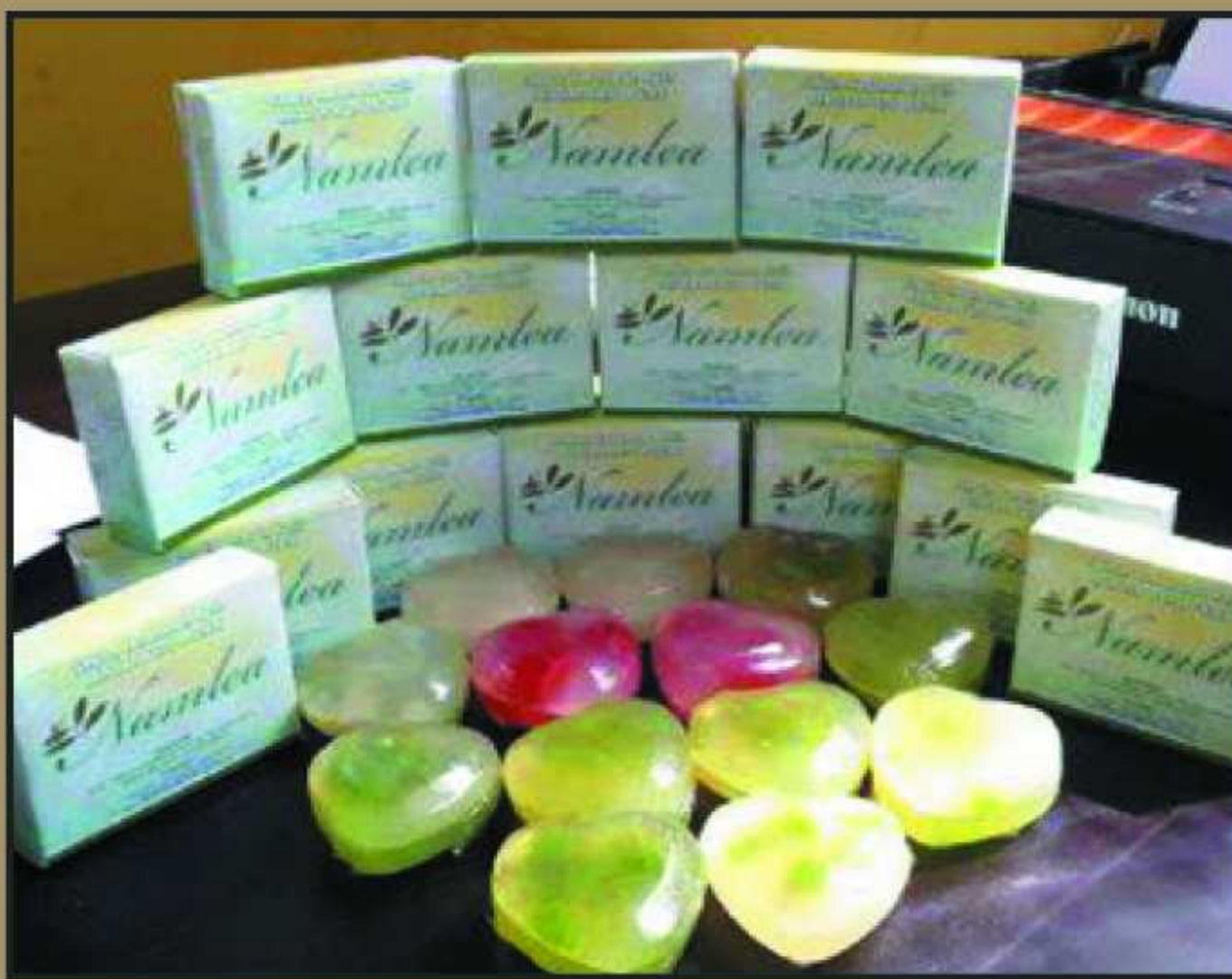
Sabun Mandi dari Minyak Kayu Putih produksi dari Desa Pela Kabupaten Buru.