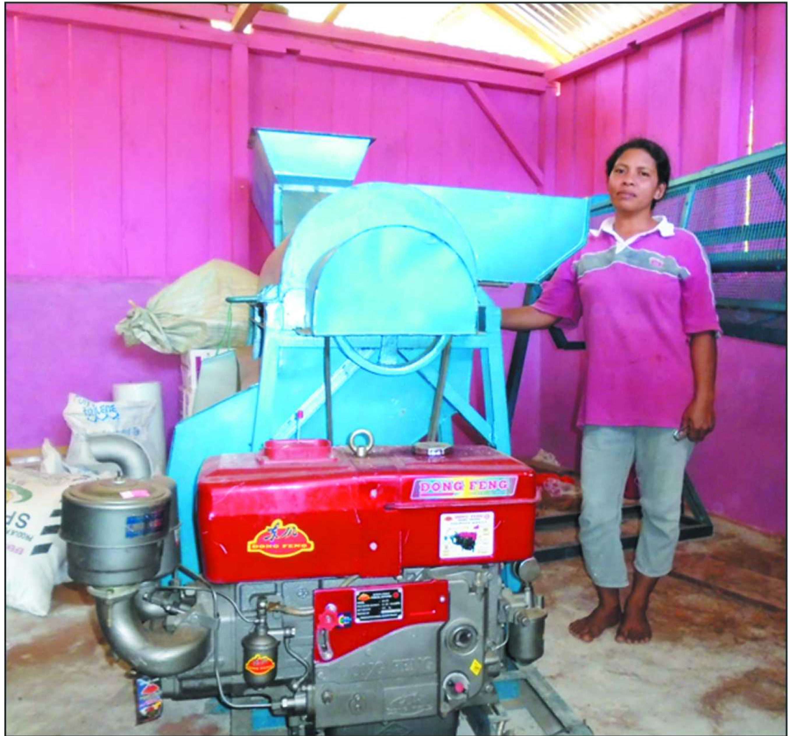
Mesin pencacah kelapa di Desa Ariate Kabupaten Seram Bagian Barat.

Sebagai contoh telah ditemukan teknologi untuk mengolah tanah pertanian. Misalnya dari mencangkul kemudian ada membajak sawah dengan menggunakan bantuan hewan ternak hingga sekarang muncul traktor yang sederhana maupun traktor