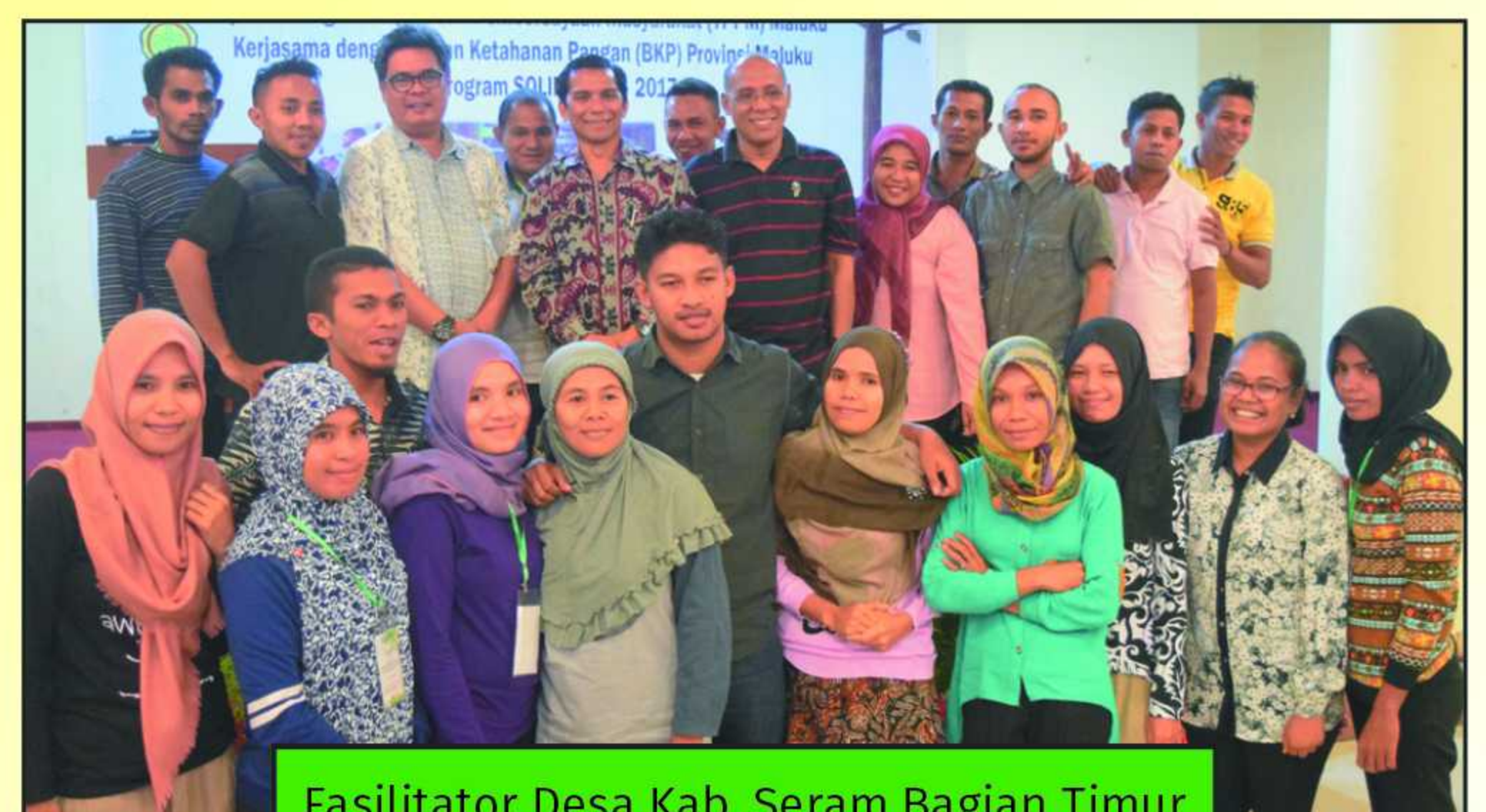
Fasilitator Desa Kab. Seram Bagian Timur