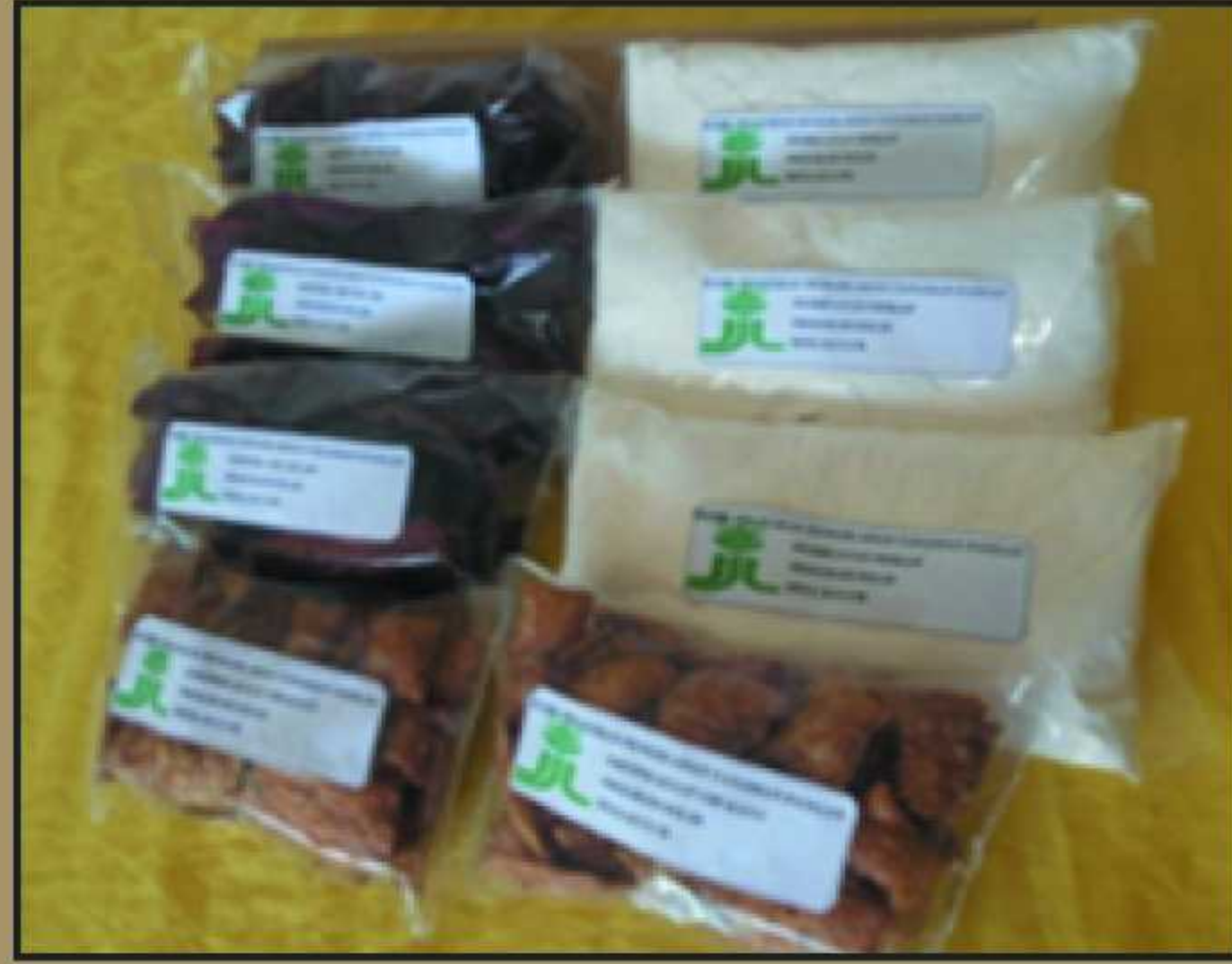
Produk Keripik Ubi Jalar dan tepung singkong produksi anggota KM desa Kulur Kabupaten Maluku Tengah.