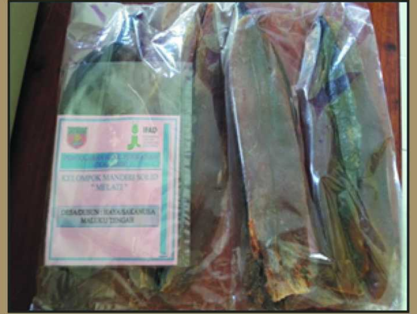
Produk Ikan Asin dari Desa Haya dusun Sakanusa Maluku Tengah.