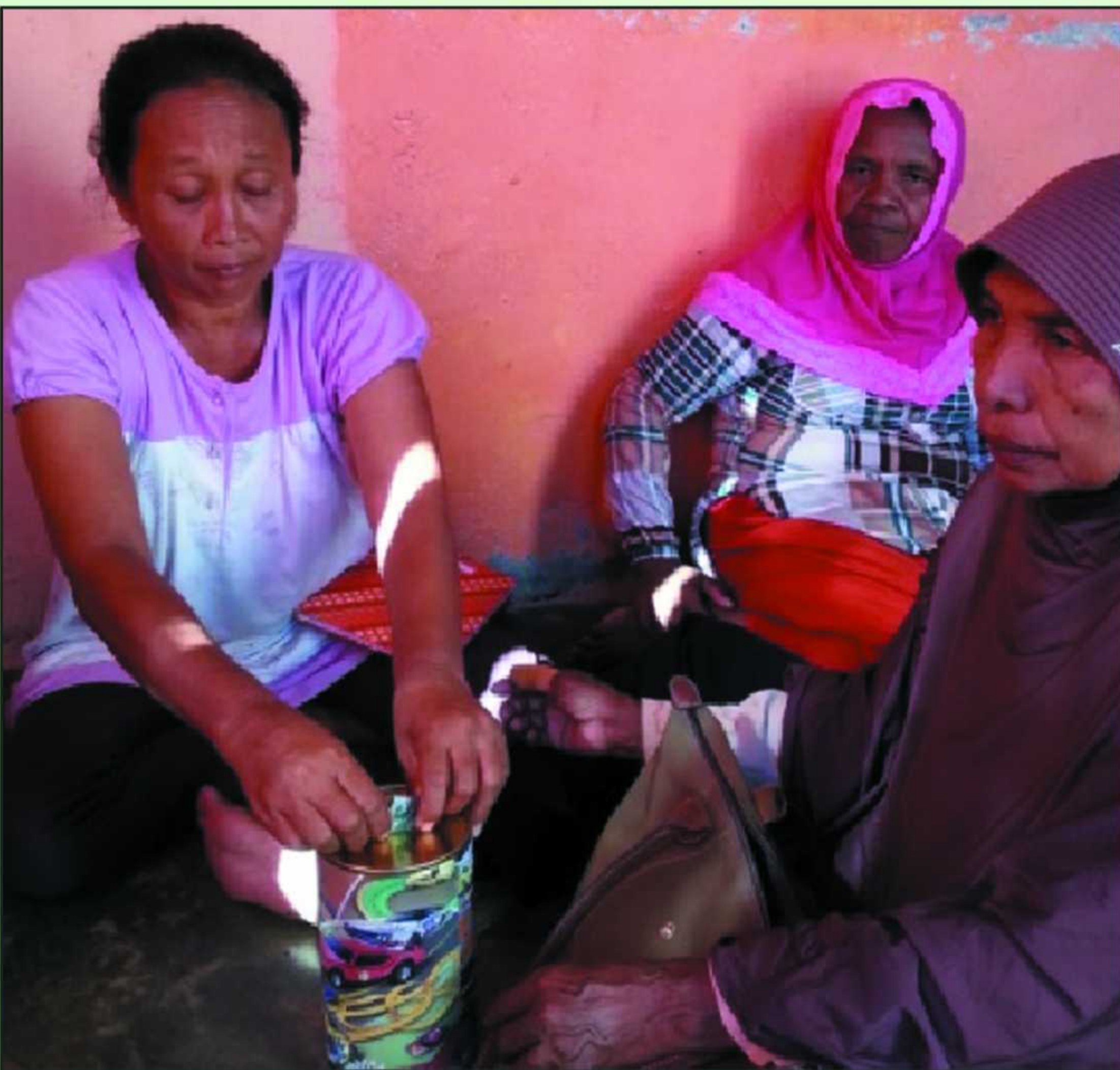
Anggota KM Sedang Memasukkan Iuran Bulanan kedalam Celengan