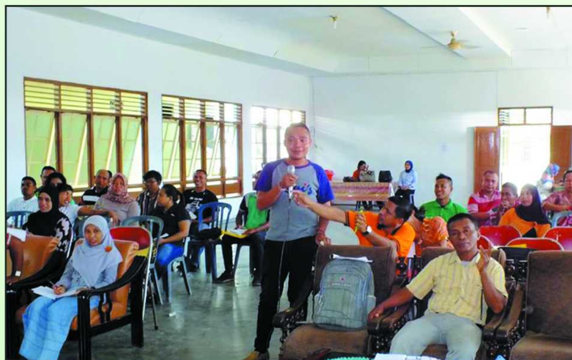
Pelatihan CD Gender dan Monev bagi PPL dan Fasdes oleh manajemen SOLID Kab. Seram Bagian Barat, 21 - 23 April 2016.