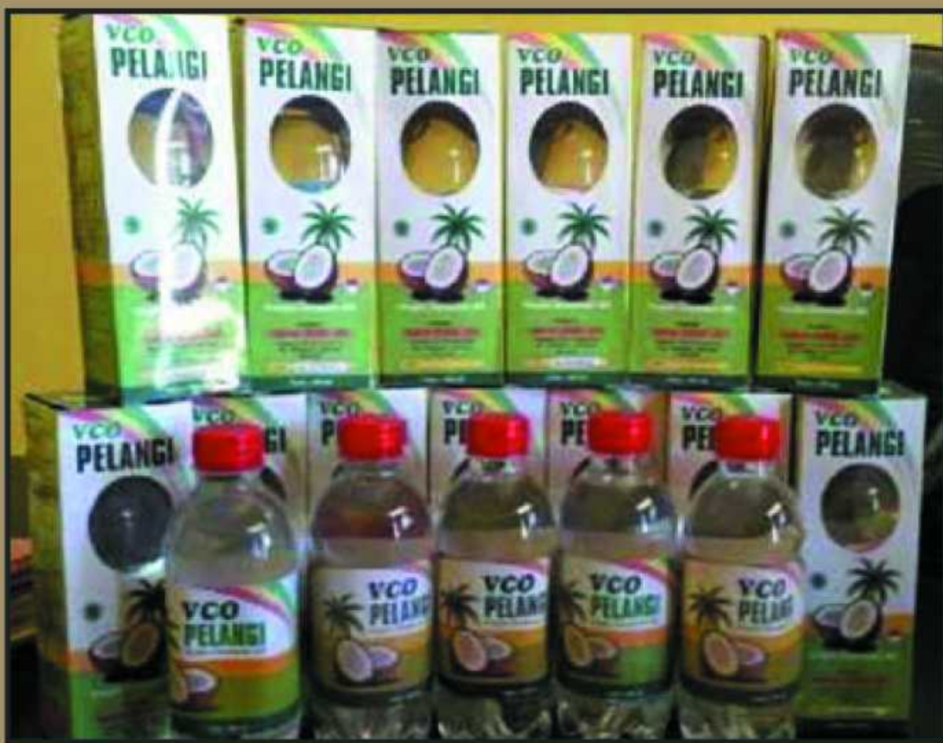
Virgin Coconut Oil (VCO) Hasil produksi federasi Kramat Jaya Desa Pela Kabupaten Buru.